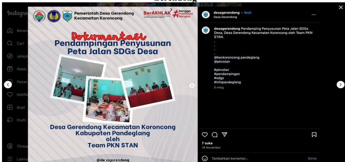
Gambar 5 Publikasi Kegiatan Pendampingan di Media Sosial Instagram Desa Gerendong