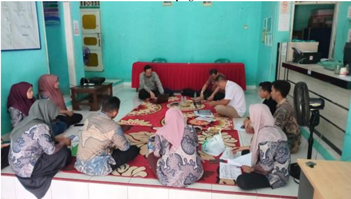
Gambar 4 Pendampingan Hari Kedua

Hari kedua kegiatan ditujukan untuk penyusunan draf dokumen secara bersama-sama (Gambar 4). Dalam proses ini, tim pengabdian berperan sebagai fasilitator teknis, sementara perangkat desa menjadi aktor utama dalam merumuskan sasaran, indikator, dan rencana program. Penyusunan dilakukan secara berlapis, dimulai dari penyusunan latar belakang, kondisi objektif, pemetaan tujuan SDGs yang relevan, hingga penyusunan matriks rencana aksi. Salah satu capaian penting adalah tersusunnya indikator lokal yang realistis dan terukur, sesuai dengan kapasitas sumber daya desa. Hal ini menunjukkan bahwa proses pendampingan tidak hanya bersifat informatif, tetapi juga transformatif.