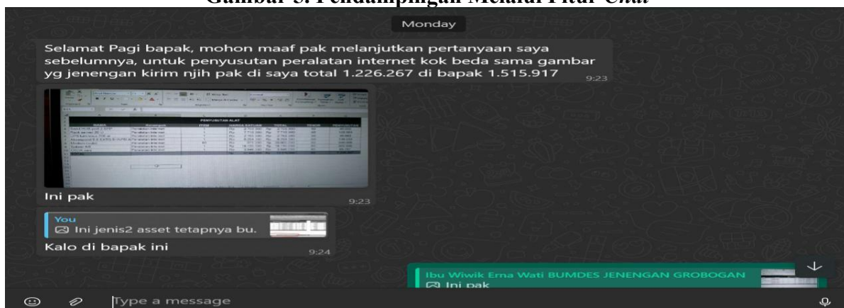
Gambar 5. Pendampingan Melalui Fitur Chat

Dengan mekanisme tersebut, interaksi antara peserta dan dosen menjadi bersifat two-way communication : peserta memperoleh arahan teknis, sementara dosen juga dapat memahami kesulitan nyata yang dialami peserta di lapangan. Proses ini diharapkan tidak hanya meningkatkan kualitas laporan keuangan yang dihasilkan, tetapi juga membentuk keterampilan analitis peserta dalam menyelesaikan masalah keuangan secara mandiri di masa mendatang (Wibowo & Nurhayati, 2022). Selain melalui WhatsApp , tim juga melakukan pendampingan melalui Zoom meeting yang diadakan satu bulan setelah pelaksanaan ToT secara luring. Kegiatan ini dimaksudkan untuk memperkuat koordinasi sekaligus mengidentifikasi permasalahan nyata yang dihadapi peserta dalam menyusun laporan berdasarkan data sebenarnya (Adedoyin & Soykan, 2020; Dhawan, 2020).