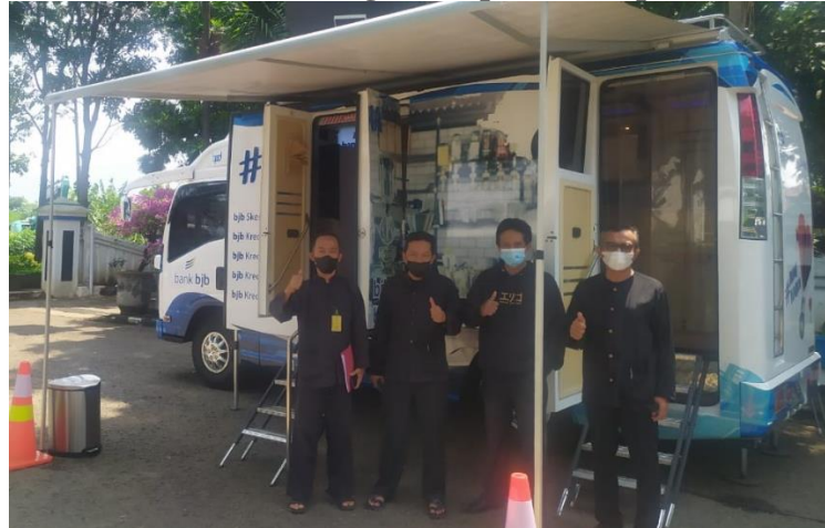
Gambar 4. Program Operasi Terpadu