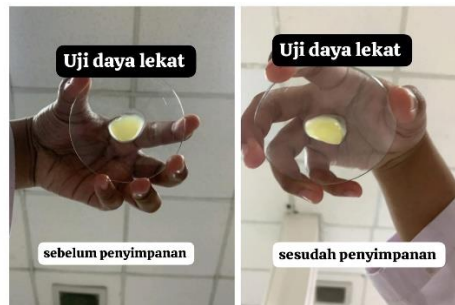
Gambar 4. Uji Daya Lekat pada sediaan balsam

Pada hasil uji daya lekat bertujuan untuk menunjukkan bahwa balsam ekstrak kencur yang baik obat tidak mudah lepas dan semakin lama pada kulit sehingga menghasilkan hasil yang di inginkan. Persyaratan daya lekat yaitu lebih dari 4 detik (Rachmalia Izzatul Mukhlisah dkk., 2016). Pengujian daya lekat pada balsam menunjukkan bahwa hasilnya sempurna, karena balsam tersebut melekat dengan baik melebihi persyaratan yang di tentukan.