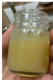
Gambar 1. Sediaan balsam

Uji organoleptik menghasilkan warna kuning berbau khas menthol dan memiliki bentuk setengah padat. Uji organoleptik dilakukan dengan cara mengamati sediaan balsam stick secara visual berdasarkan bentuk, warna dan bau (Ayulia dkk., 2018)