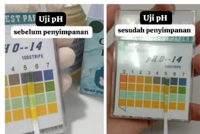
Gambar 2. Uji pH pada sediaan balsam

Pada uji pH sediaan balsam ekstrak kencur ini tidak menyebabkan iritasi pada kulit dikarenakan hasil pH yang di dapatkan tidak melebihi SNI pH kulit yaitu antara 4,5 dan 6,5 (Barru Hakam Fajar Sidiq dkk., 2018)