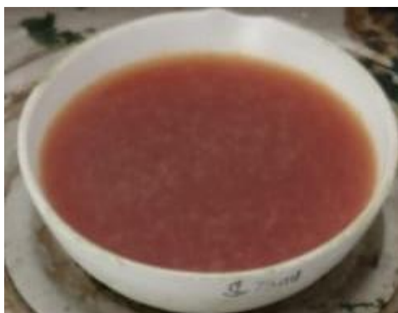
Gambar 1 Ekstrak Etanol Rimpang Kencur ( Kaempferia galanga ) (Dokumentasi Pribadi, 2023).

Dari Tabel 1 diketahui bahwa dari 500 gram serbuk simplisia rimpang kencur ( Kaempferia galanga ) yang direndam dengan pelarut etanol 96% menghasilkan ekstrak sebanyak 92,62 gram. Sehingga diperoleh rendemen ekstrak yaitu 18,52 %. Hal ini sesuai dengan persyaratan pada Farmakope Herbal Indonesia Edisi 1 bahwa hasil rendemen harus lebih dari 8,3%.