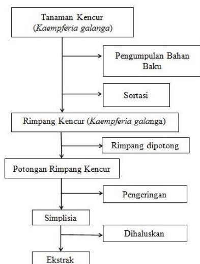
Bagan 1 Skema Kerja