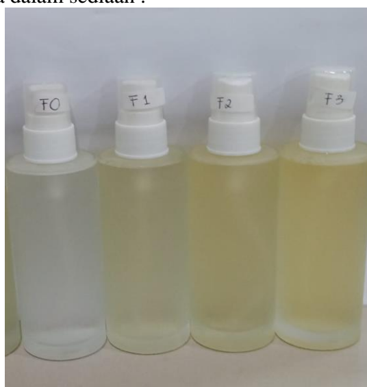
Gambar 2 Sediaan Sunscreen Spray Ekstrak Etanol Rimpang Kencur ( Kaempferia galanga ) Sebagai Moisturizer

Pengujian organoleptik pada sediaan sunscreen ekstrak etanol menggunakan panca indera dalam mendeskripsikan bentuk, warna, dan bau. Pengujian ini merupakan cara yang cukup sederhana. Indera pengelihatan yang berhubungan dengan warna serta bentuk. Indera peraba berkaitan dengan tekstur dan konsistensi. Indera pembau digunakan sebagai suatu indikator mengenai aroma dalam sediaan .