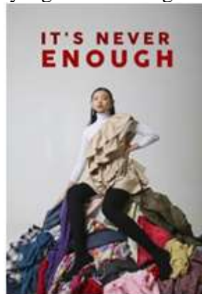
Gambar 2. Hasil Rancangan Infografis

campaign limbah tekstil dalam sebuah ilustrasi dengan jenis fotografi. Tujuan dari pembuatan foto tersebut, Sangrawati et al., (2022) menginginkan agar masyarakat sadar akan dampak dari fast fashion dan masyarakat mau melakukan perubahan menuju sustainable fashion . Penggunaan media fotografi diharapkan menjadi media komunikatif dalam penyampaian pesan dari Sangrawati et al., (2022) kepada masyarakat. Salah satu fotografi yang dihasilkan yaitu foto dengan judul “ Landfill ” yang berarti Tempat Pembuangan Akhir. Alasan pemberian judul tersebut karena busana/pakaian yang tidak terjual dan juga busana/pakaian yang sudah tidak layak pakai akhirnya terjual ke Tempat Pembuangan Akhir yang menyebabkan menumpuknya pakaian-pakaian tersebut hingga menjadi timbunan sampah pakaian. Sangrawati et al., (2022) menyampaikan dampak dari fast fashion serta sulitnya daur ulang sampah pakaian dapat menyebabkan penumpukan sampah yang terus meningkat.