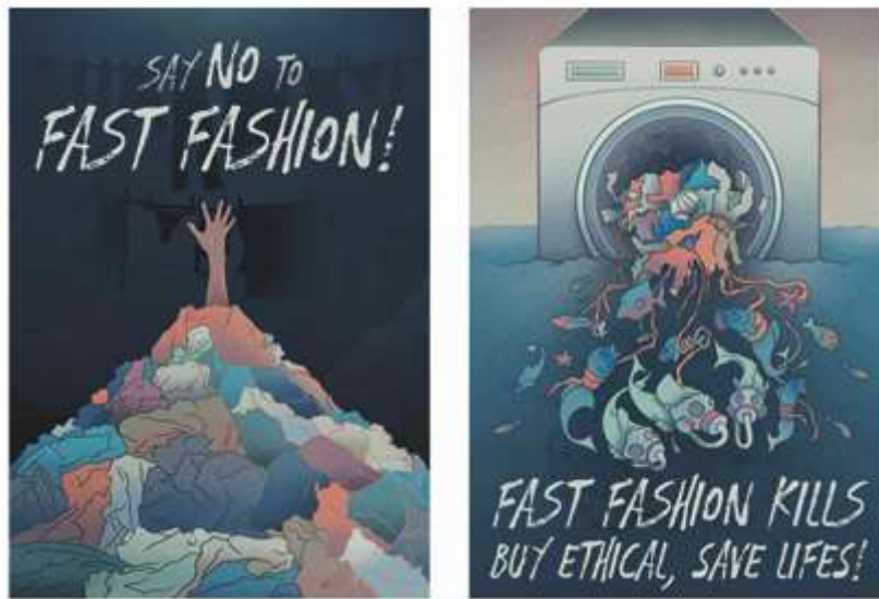
Gambar 1. Dua Seri Poster

Poster diatas menjelaskan bahwa fast fashion menyebabkan konsumsi yang berlebih dan mengakibatkan terjadinya meningkatnya penumbukan sampah pakaian yang sulit terurai, serta poster kedua menjelaskan bahwa limbah tekstil atau pakaian tersebut dapat menyebabkan peningkatan limbah di perairan, baik sungai, hingga lautan, dimana atas limbah tersebut dapat menyebabkan pencemaran lingkungan yang dapat membahayakan kesehatan.