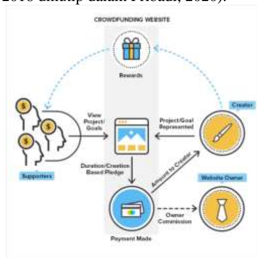
Gambar 1. Proses bisnis Reward-based crowdfunding

Platform pihak ketiga yang digunakan oleh narasumber penulis sastra digital, antara lain Karyakarsa dan Trakteer. Dirangkum dari masing-masing laman resmi platform tersebut, platform pihak ketiga ini merupakan milik anak bangsa. Karyakarsa dimiliki oleh PT Karya Karsa Indonesia dan Trakteer dimiliki PT Apresiasi Karya Nusantara. Karyakarsa dan Trakteer dapat digolongkan sebagai perusahaan crowdfunding untuk kreator seni (DDTC, 2021). Crowdfunding adalah layanan urunan dana yang berdasarkan basisnya dapat dikategorikan menjadi empat jenis, yaitu donasi ( donation-based crowdfunding ), penghargaan ( reward-based crowdfunding ), pinjaman ( lending-based crowdfunding ), dan ekuitas ( equity-based crowdfunding ) (Serfiyani, 2018 dikutip dalam Pribadi, 2020).