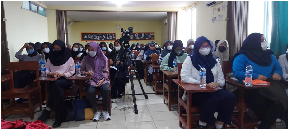
Gambar 3. Sesi Pertanyaan

waktu sekitar 45 menit. Pertanyaan yang diajukan perbedaan akuntansi pemerintah pusat dan daerah, peluang karir di perpajakan dan masalah terkait keuangan lainnya sesuai dengan materi yang disampaikan oleh para narasumber. Akan tetapi, moderator mempersilakan jika para peserta bertanya di luar materi dengan syarat masih berhubungan dengan tema seminar (Gambar 3).