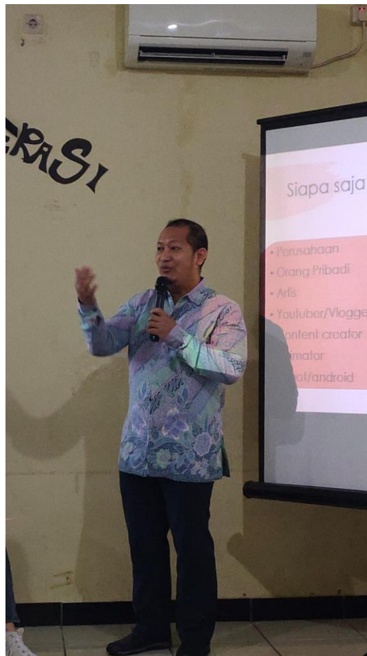
Gambar 5. Narasumber kedua

Narasumber kedua menyampaikan beberapa hal terkait konsep dasar pajak dan apa saja yang harus dipersiapkan oleh para lulusan SMK di masa depan (Gambar 5)