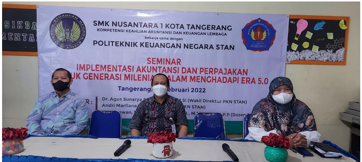
Gambar 1. Pembukaan Seminar

Tahap Selanjutnya kedua yaitu pelaksanaan seminar. Seminar diselenggarakan pada hari sabtu tanggal 26 Februari 2022 mulai pukul 09.00 sampai dengan pukul 12.00 WIB. Jumlah peserta yang hadir langsung sebanyak 60 orang terdiri dari kepala sekolah, guru, dan siswa SMK di lingkungan Kota Tangerang. Sedangkan, 100 orang mengikuti seminar secara daring. Seminar dibuka oleh seorang master of ceremony (MC). Selanjutnya, diadakan dengan do'a bersama agar kegiatan seminar berjalan dengan lancar. Selanjutnya, pemberian kata sambutan dari Kepala Sekolah SMK Nusantara 1 (Gambar 1). Berikutnya, diteruskan dengan penyampaian materi oleh tiga orang narasumber, yaitu Dr. Agus Sunarya, Ak. Andri Marfiana, MBA, dan Ferry Irawan, MPP. Agus Sunarya Wakil Direktur Bidang Keuangan dan Umum Politeknik Keuangan Negara STAN. Andri Marfiana dan Ferry Irawan merupakan dosen pengampu mata kuliah perpajakan Politeknik Keuangan Negara STAN. Penyampaian materi oleh narasumber pertama dengan topik mengenal akuntansi pemerintahan. Penyampaian oleh narasumber kedua terkait pengantar dan konsep perpajakan. Selanjutnya, materi mengenai pembayaran dan pelaporan pajak disampaikan oleh narasumber ketiga. Waktu yang dialokasikan untuk ketiga pemateri adalah 120 menit (Gambar 2).