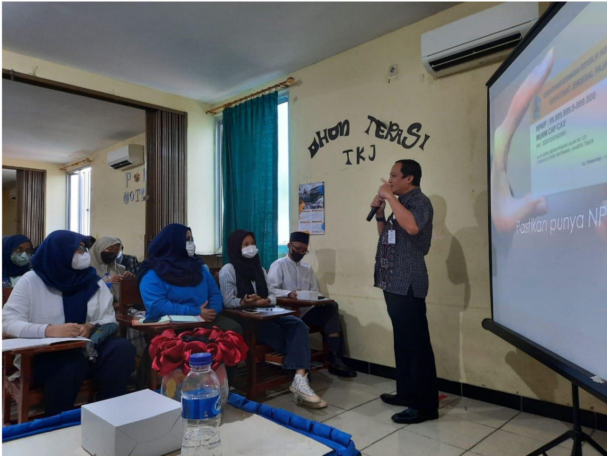
Gambar 6. Narasumber ketiga