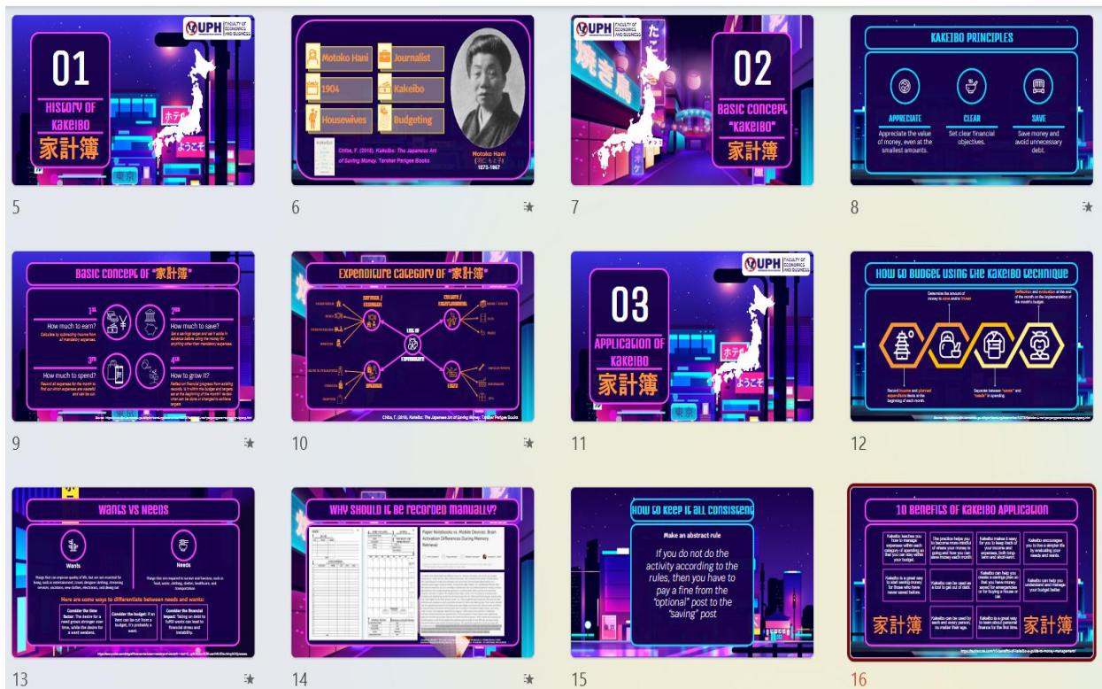
Gambar 3. Materi Webinar “ Kakeibo (家計簿) Japanese-style budgeting journal ”

Diskusi interaktif mengungkap bahwa Gen Z cenderung mengalami kesulitan dalam mengelola keuangan akibat gaya hidup impulsif dan dominasi transaksi digital yang minim jejak reflektif. Metode Kakeibo , yang menekankan pencatatan manual dan pertanyaan reflektif seperti “Apa yang benar-benar penting bagi saya?”, terbukti relevan untuk membangun kesadaran finansial (Laturette et al., 2021). Sebagian peserta menyatakan bahwa pendekatan ini membantu mereka menunda pembelian dan mempertimbangkan nilai jangka panjang dari pengeluaran.