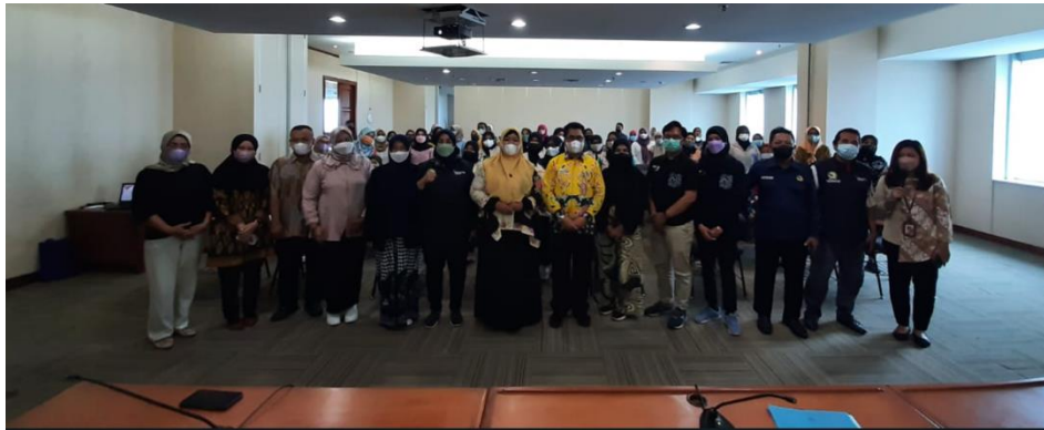
Gambar 4 Foto Bersama Peserta kegiatan