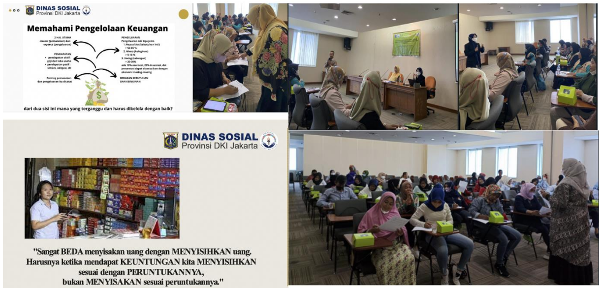
Gambar 2 Penyampaian Materi

Pada kegiatan ini juga dilakukan ice breaking dengan tujuan untuk mengurangi rasa jenuh dan pengat setelah menerima materi dan kemudian dilanjutkan dengan evaluasi kesehatan keuangan masing-masing peserta pelatihan: