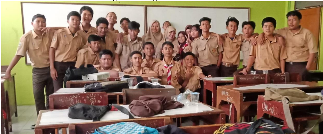
Gambar 1 Kegiatan Pengabdian di SMK Adi Luhur 2 Jakarta

Berdasarkan pengabdian kepada masyarakat yang dilakukan, terkumpul berbagai data tentang pelaksanaan penanaman kesadaran pajak di SMK Adi Luhur 2 Jakarta. Berikut dokumentasi tim abdimas dan para siswa: