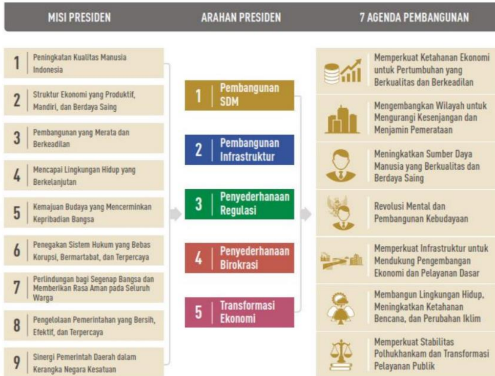
Gambar 1. Keterkaitan Visi, Misi, dan Arahan Presiden dan 7 Agenda Pembangunan (Sumber: Rencana Pembangunan Jangka Menengah Nasional Tahun 2020-2024)

Pembangunan berbasis wilayah dipengaruhi oleh beberapa faktor seperti sumber daya manusia yang memiliki kualitas dan daya saing yang baik, transformasi ekonomi, serta memperhatikan lingkungan hidup, kerentanan bencana, dan kondisi politik dan keamanan yang stabil. Peningkatan kualitas dan daya saing sumber daya manusia dicapai melalui revolusi mental, pengembangan kebudayaan, dan pembangunan infrastruktur. Selain itu, pertumbuhan ekonomi diharapkan mencapai rata-rata 5,7-6% per tahun dengan struktur ekonomi yang lebih baik. Kondisi politik dan keamanan yang stabil dapat dicapai melalui penyederhanaan regulasi dan birokrasi, serta menjaga stabilitas politik dan keamanan.