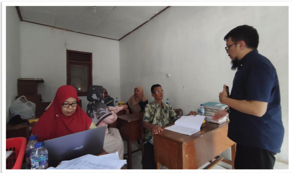
Gambar 3. Kegiatan Tahap Kedua: Visitasi BUMDES Sleman

Namun demikian, BUMKAL hanya melayani jasa simpan pinjam kepada masyarakat Sinduharjo saja dan tidak membuka layanan kepada rakyat di desa lainnya. Proses penagihan piutang pun dilakukan secara kekeluargaan dengan melibatkan pihak Kepala Desa dan keluarga