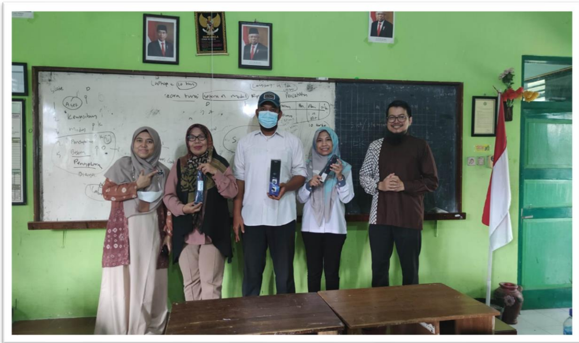
Gambar 2. Kegiatan Tahap Pertama: Pelatihan Akuntansi BUMKAL Sleman

Kegiatan yang bertemakan “Ekskalasi Literasi Penyusunan Laporan Keuangan BUMKAL” merupakan bagian dari kegiatan pengabdian masyarakat untuk pemberdayaan BUMKAL di Kabupaten Sleman. Kegiatan tersebut merupakan hasil kerjasama antara Politeknik Keuangan Negara STAN yang diwakili oleh tim pelaksana dan Pemerintah Kabupaten Sleman yang diwakili oleh DPMD. Kegiatan ini berlangsung selama enam bulan, dimulai pada tanggal 6 Juni 2023 hingga 12 Desember 2023. Kegiatan ini dibagi menjadi beberapa tahapan, tahap pertama dimulai dengan pelatihan penyusunan laporan keuangan selama dua hari. Dalam pelatihan ini, para peserta mendapatkan materi tentang dasar-dasar akuntansi dan teknik penyusunan laporan keuangan BUMKAL. Mereka juga diberikan kesempatan untuk mempraktikkan penyusunan laporan keuangan, baik secara manual maupun menggunakan aplikasi Microsoft Excel.